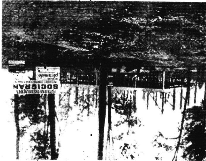
Construção da extinta SOCIGRAN - Atual UNIGRAN

Na década de 70 surgiu na região da Grande Dourados a necessidade de proporcionar a sociedade crescente e em ascensão, formação educacional superior, a fim de elevar o seu nível profissional, cultural e social. Poucos eram os estudantes que tinham possibilidades de mudança para outros Estados, com o propósito de adquirir a formação que almejavam e que a região necessitava. A Instituição surgiu pioneira, com o propósito de proporcionar ensino superior de qualidade, para formar profissionais que atenderiam essa carência da região.