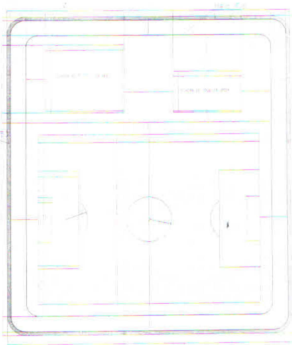
Planta Baixa Esc.: 1/750