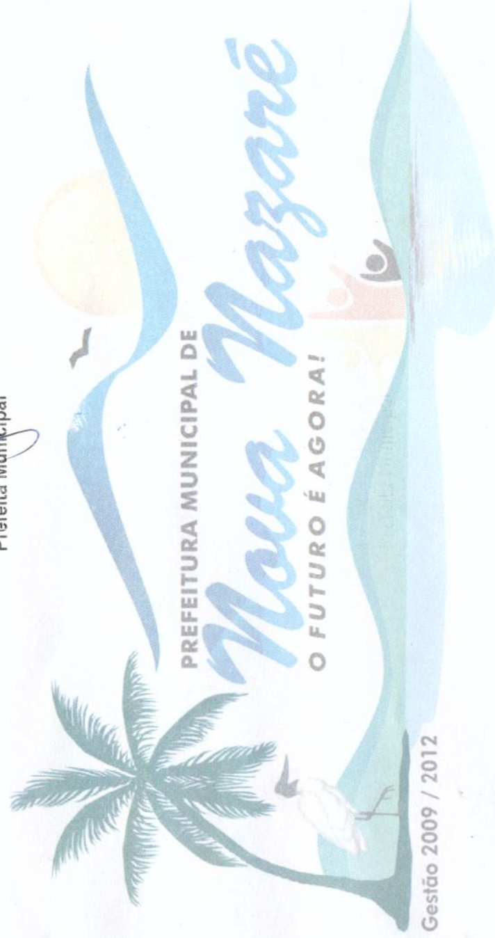
RAILDA DE FATIMA ALVES Prefeita Municipal

Fones: (66) 3467-1019 / 1020 / 1018 / 1030